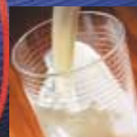
Mejeri & fødevarer

Økonomiser, superheater, kondensattank, aflufter, fødevandstank, bundblæsningsstank og O 2 -forbrændingskontrol.