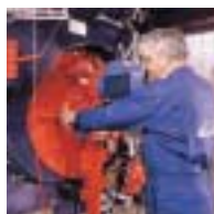
Aalborg Industries har designet effektive brændere specielt til MISSION™ 3-Pass kedlerne.